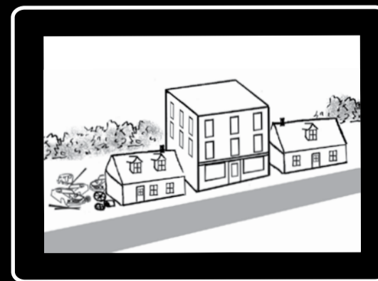
Immeuble de trois étages entre deux maisons patrimoniales; cours d'entreposage et ferraille.