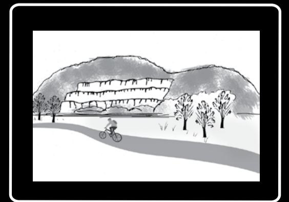
Une carrière de pierre bien visible gruge le flan d'une montagne.